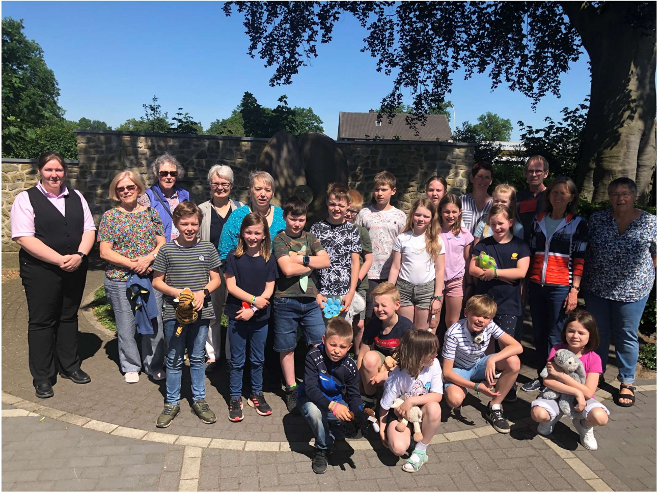
Ein Erinnerungsfoto an der Trauer- und Gedenkstätte rundet diesen Tag ab.